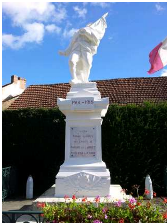
Monument après travaux

Comme vous avez pu le constater, les travaux de réfection du Monument aux Morts sont terminés. Ils ont été réalisés par l'entreprise LP3 Construction de Semur en Auxois pour un montant de 7165.00€. Une souscription publique avait été lancée auprès de la Fondation du Patrimoine et diverses subventions ont été sollicitées par la Municipalité.