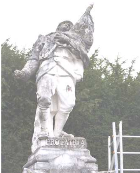
Monument avant travaux